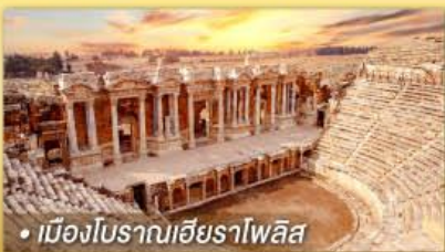
• เมืองโบราณเฮียราโพลิส