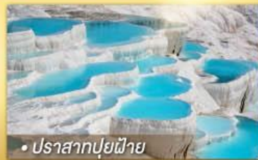
• ปราสาทปูยฝ้าย