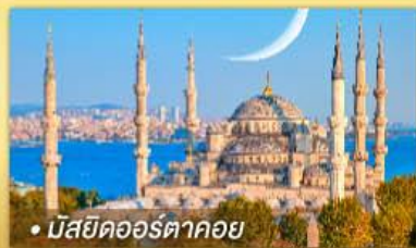
• มัสยิดออร์ตาคอย