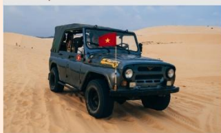
ทะเลทรายขาว