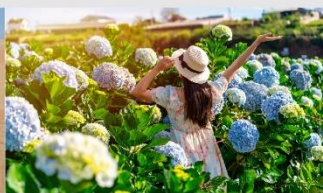
สวนดอกไฮเดรนเยีย