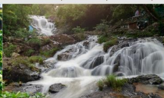
น้ำตกดาตันลา